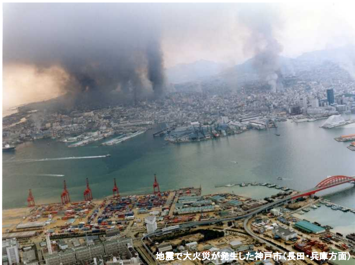
地震で大火災が発生した神戸市(長田・兵庫方面)

多くの教訓と課題を残した阪神・淡路大震災から25年。近年、近畿地方でも大規模自然災害が続き、多くの被害がありました。今後、南海トラフ大地震の発生も心配され、その対策が急がれています。国土交通省近畿地方整備局では、平常時の交通混雑の解消や経済活動の円滑化だけでなく、大災害時の避難や救急・救援活動を支える「命を守る道路インフラ」整備を進めています。