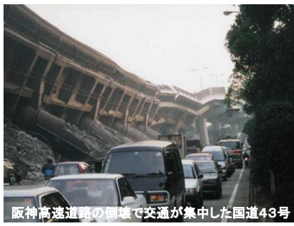
阪神高速道路の倒壊で交通が集中した国道43号

平成7(1995)年1月17日午前5時46分 兵庫県南部地震発生 マグニチュード7.3 死者・行方不明者6,437名 負傷者43,792名 ライフラインは6~93日間停止 ※内閣府「防災白書」阪神・淡路大震災について(確定報)