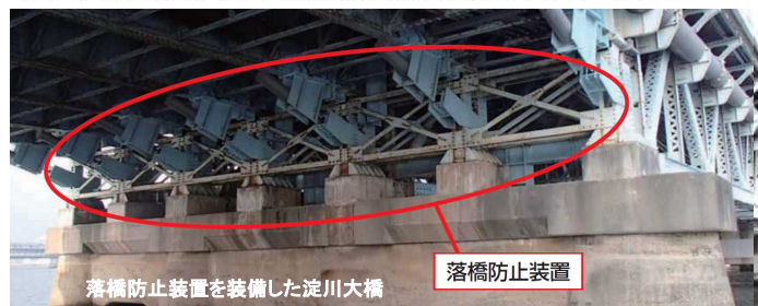
落橋防止装置を装備した淀川大橋

阪神・淡路大震災での橋梁の被害を踏まえ、耐震補強対策を実施しています。特に、大規模災害時に避難・救助・物資供給等の応急活動に不可欠な緊急輸送道路では耐震補強を加速化させています。