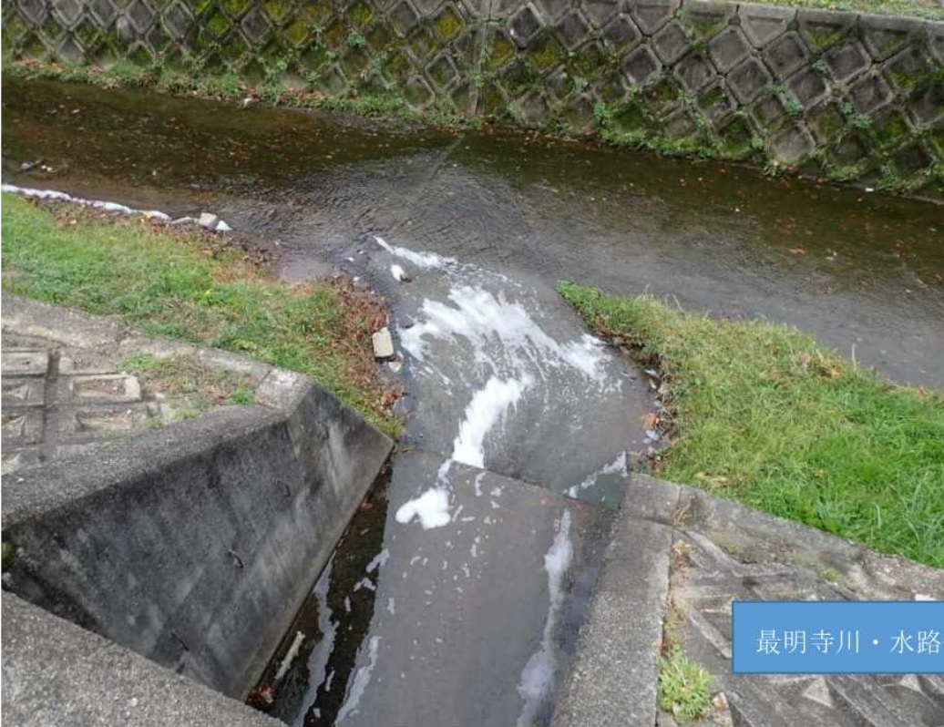
最明寺川・水路合流地点