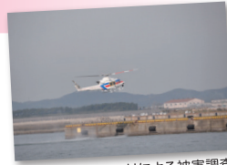
ヘリによる被害調査