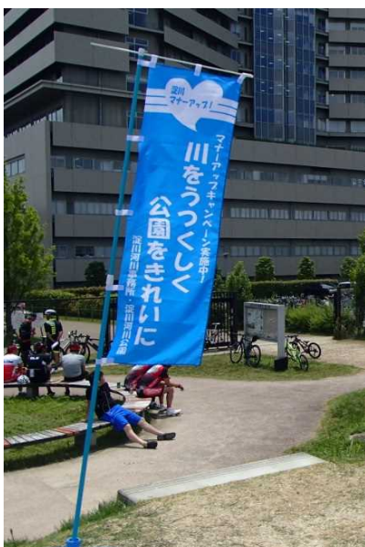
▲のぼりを立てて活動