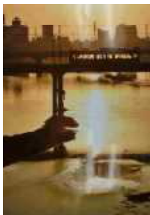
<大阪府知事賞(写真の部)>