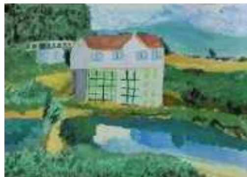
<奈良県知事賞(絵の部)>