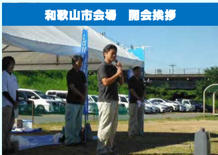
和歌山市会場 開会挨拶