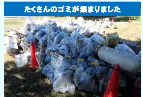
たくさんのゴミが集まりました