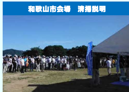
和歌山市会場 清掃説明