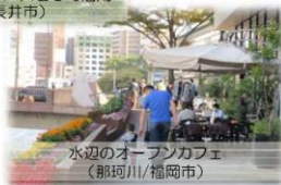
水辺のオープンカフェ (那珂川/福岡市)