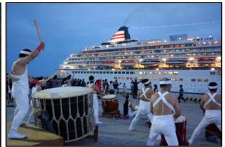
クルーズ船おもてなし