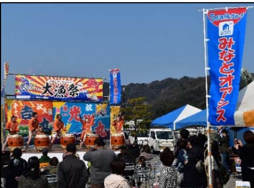
地域振興イベントの開催状況