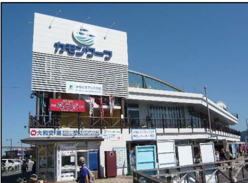
構成施設のイメージ