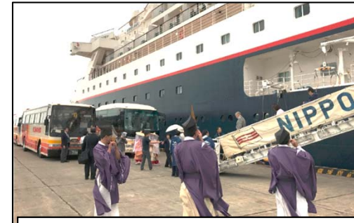
クルーズ客船受入・おもてなし