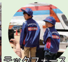
テックフォース子ども体験