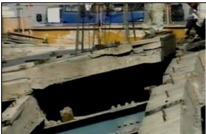
切断した床版の撤去