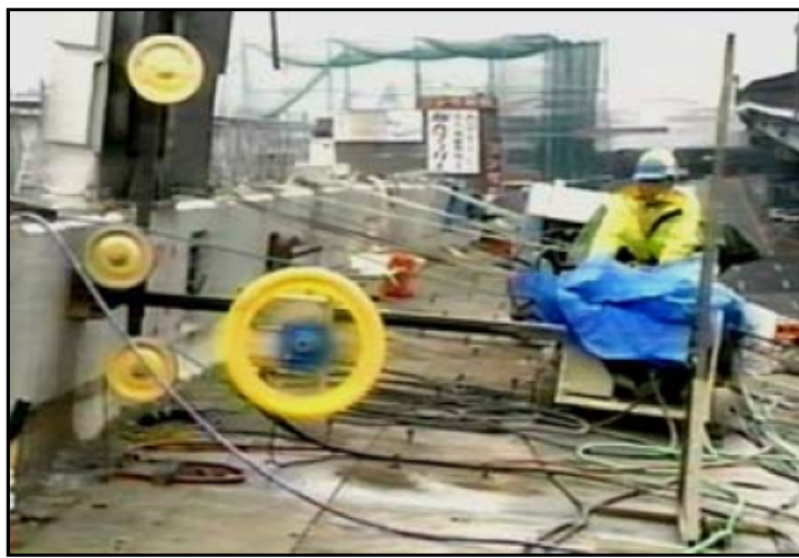
橋梁 高欄の切断作業