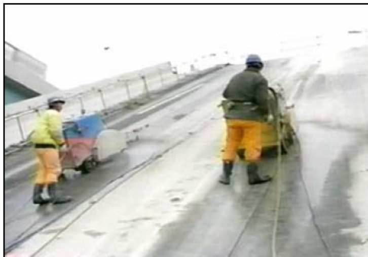
橋梁 床版の切断作業