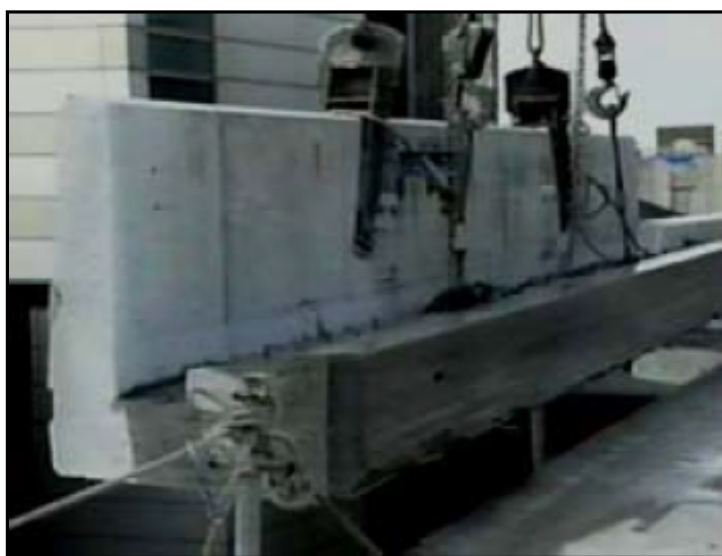
切断した壁高欄の撤去