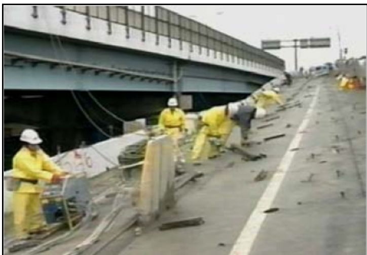
橋梁 床版の切断作業