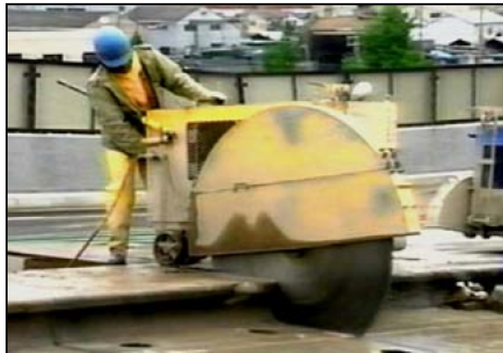
橋梁 床版の切断作業