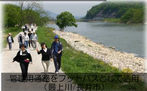
管理用通路をフットパスとして活用 (最上川/長井市)