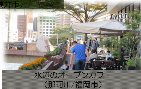
水辺のオープンカフェ (那珂川/福岡市)