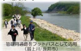
管理用通路をフットパスとして活用 (最上川/長井市)