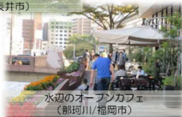
水辺のオープンカフェ (郡珂川/福岡市)