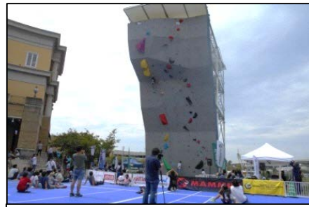
全国小学生クライミング大会