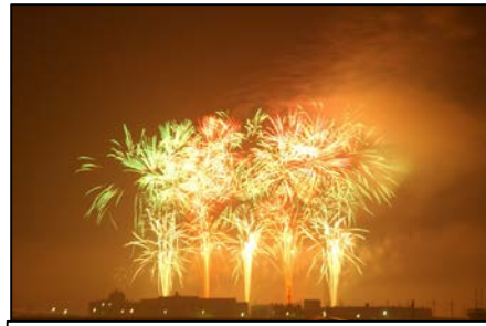
岸和田港まつり (花火大会)