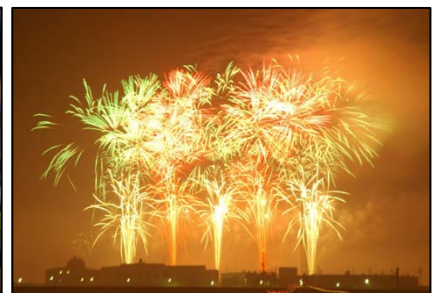
岸和田港まつりの花火大会