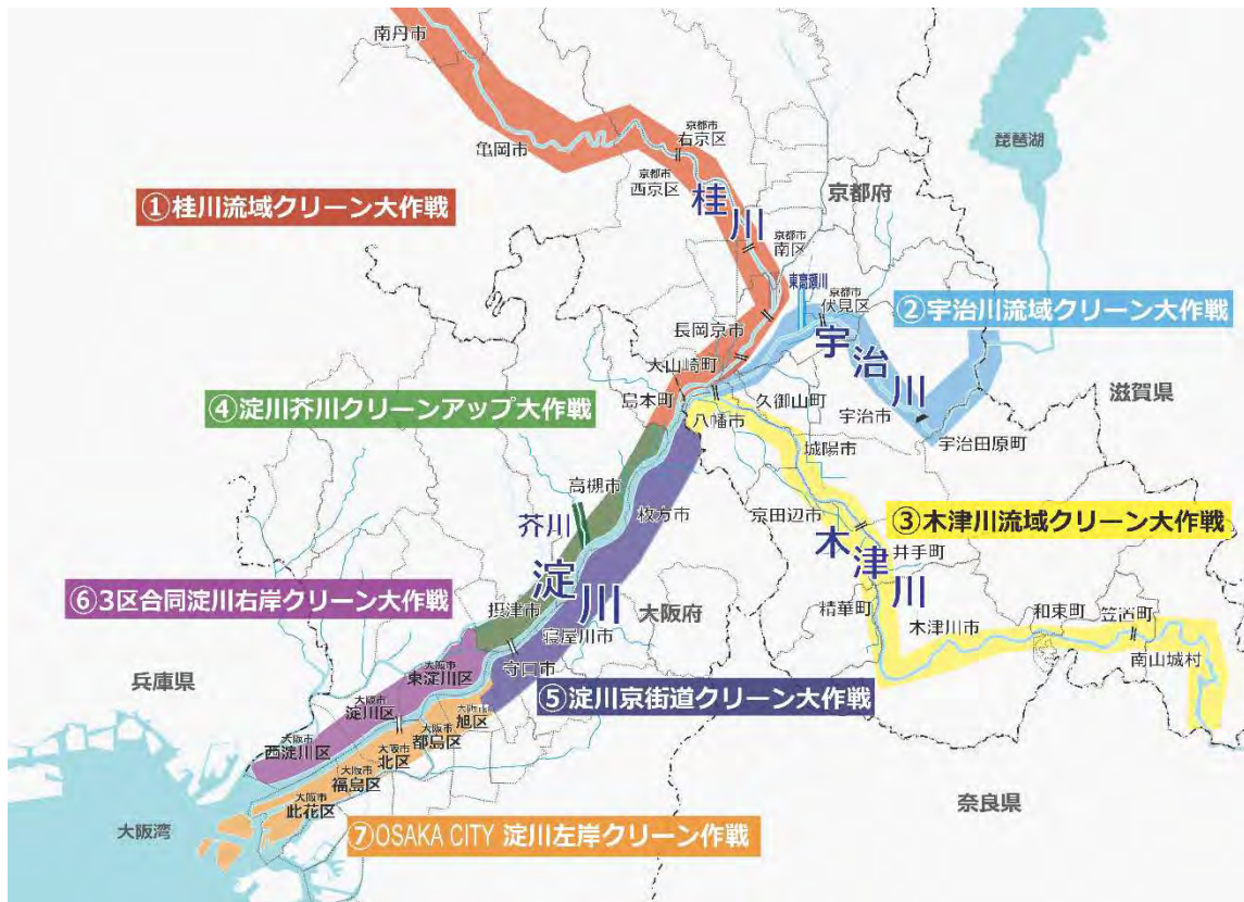
図1 淀川水系一斉美化アクション実施場所