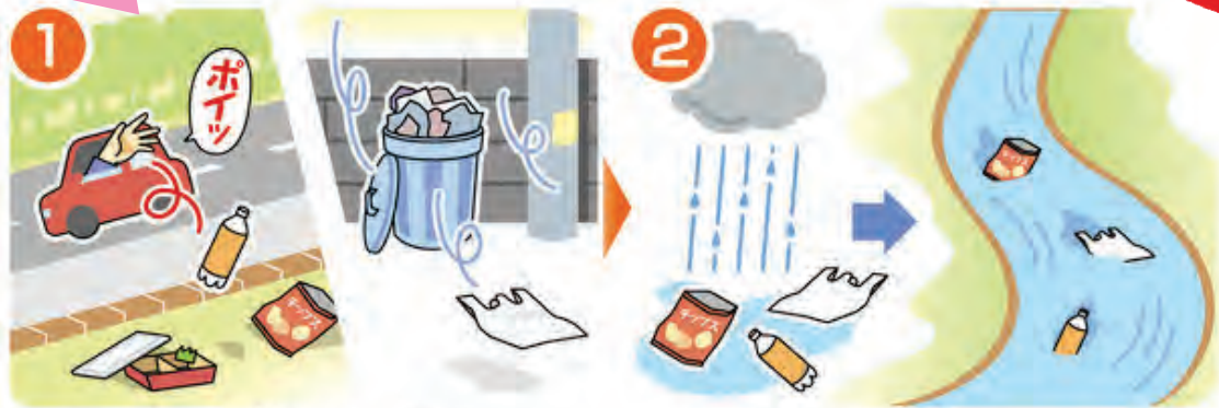
1 ポイ捨てや風でプラスチック製品が散乱