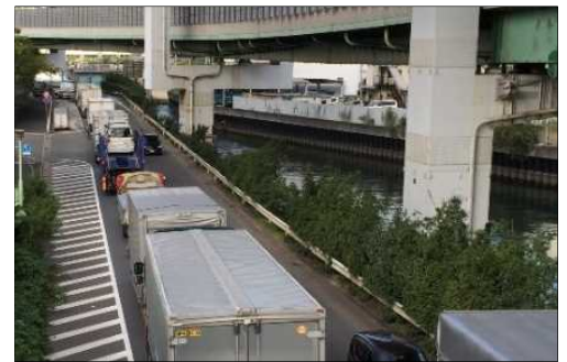
写真① 灘浜住吉川線の渋滞状況