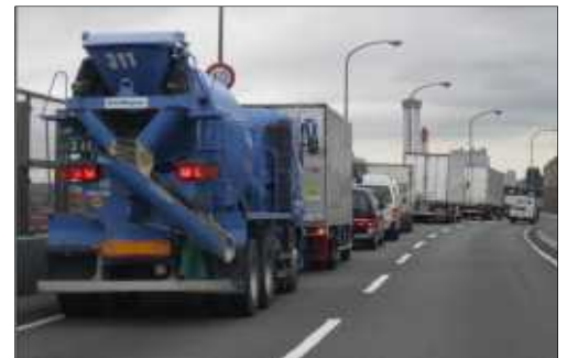
写真② 高羽ランプ出口の渋滞状況