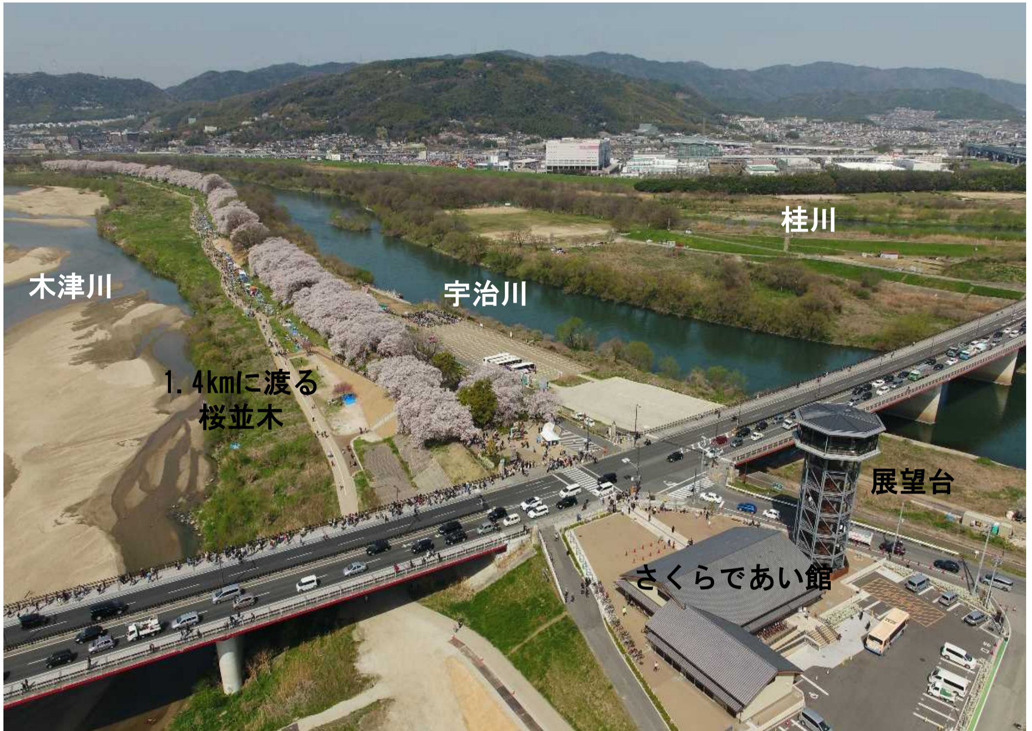
▲御幸橋上流側から下流方向を望む (H30. 4)