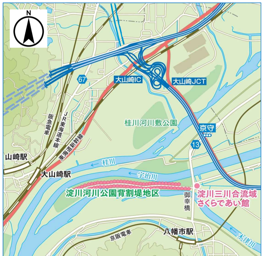
▲背割堤地区案内図