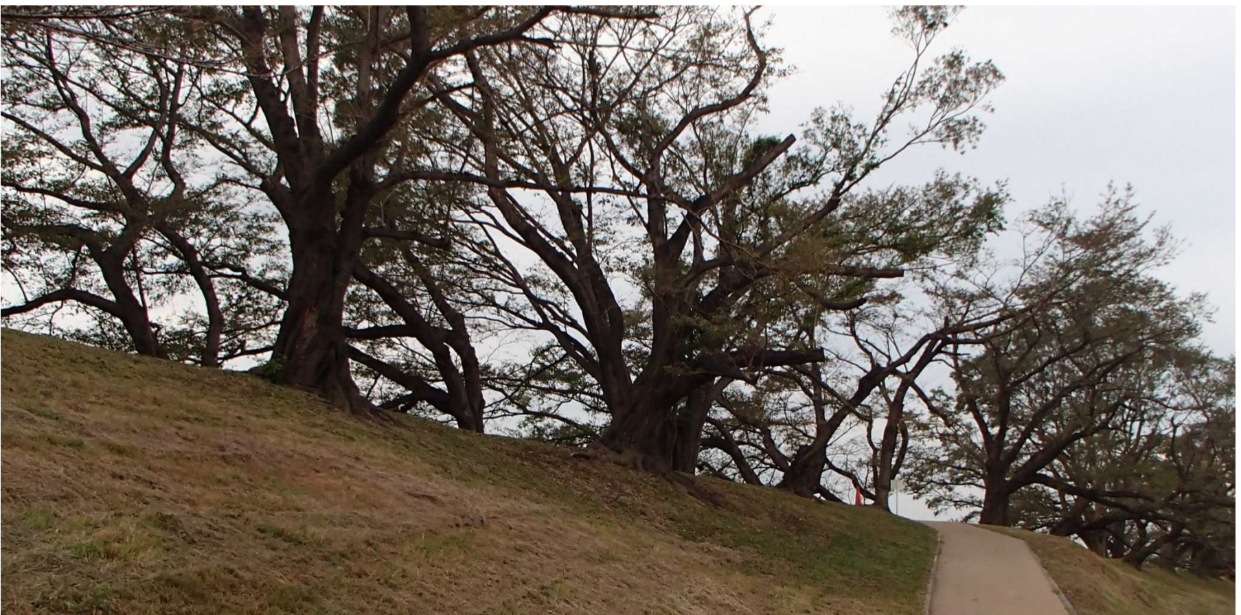
▲木津川側の作業完了状況(下流から上流方向)