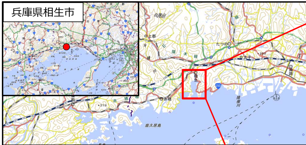
国土地理院地図（電子国土Web）( http://maps.gsi.go.jp )をもとに国土交通省作成