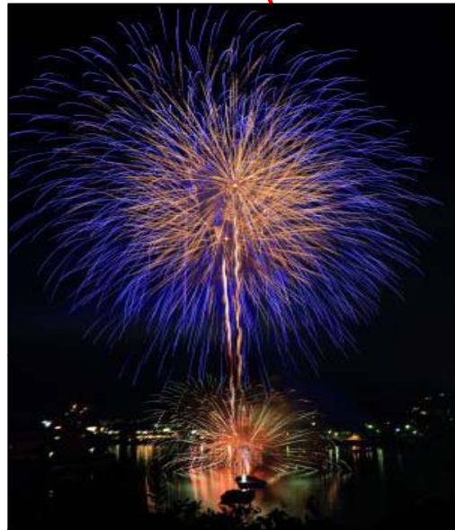
花火大会 (相生ペーロン祭前夜祭)