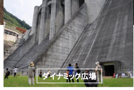
ダイナミック広場

大滝ダムでは、8月5日に「大滝ダム体験ツアー」を開催します。今回のイベントでは、ダムの役割や洪水の恐ろしさなどを身をもって体験していただけるよう、普段は入れないゲート室やダイナミック広場と、大滝ダム・学べる防災ステーションの豪雨体験をご案内致します。