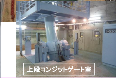
上段コンジットゲート室