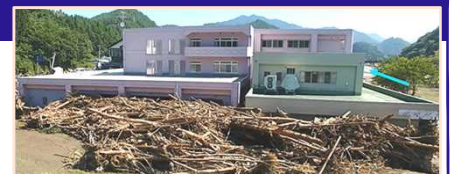
平成28年台風10号により、岩手県の要配慮者利用施設では利用者9名の全員が死亡。