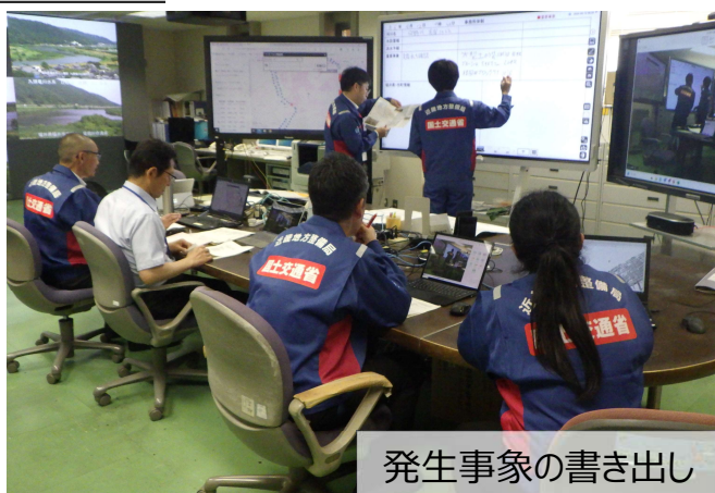
発生事象の書き出し