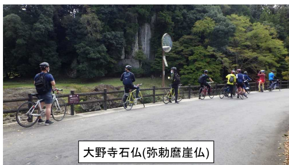
大野寺石仏(弥勒磨崖仏)