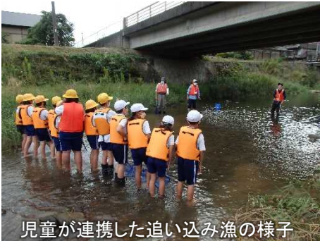
児童が連携した追い込み漁の様子