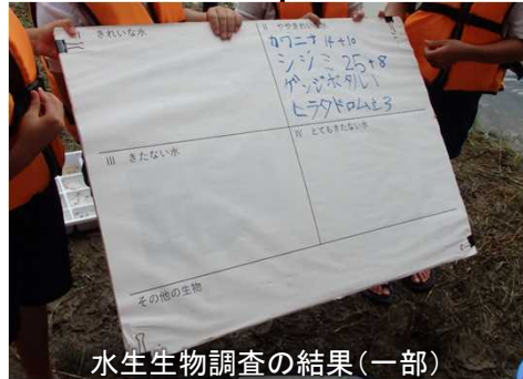
水生生物調査の結果（一部）