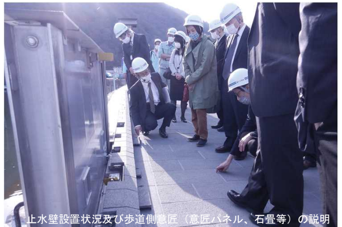
止水壁設置状況及び歩道側意匠（意匠パネル、石畳等）の説明

可動式止水壁や意匠の実物に触れていただき、これまで議論してきたものが現地で実現しつつあることを説明