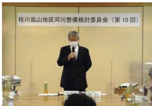
道奥新委員長挨拶