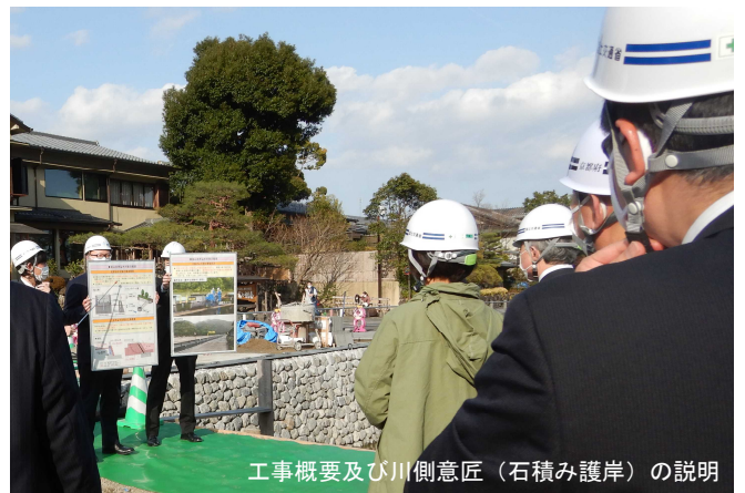
工事概要及び川側意匠（石積み護岸）の説明