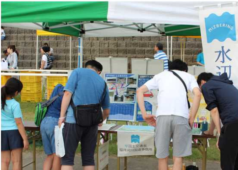
河川事業の紹介 (福井河川国道事務所)

○会場では、正午より青空の下でヨガの体験教室や、ウクレレやフォークソングなど多くのアーティストによるライブと地元料理の出店により水辺がMIZBERINGカラーで賑わう一日となりました。