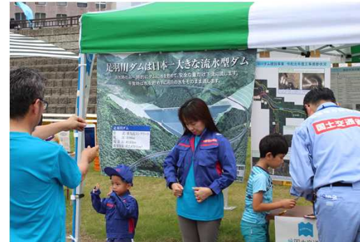
ダム事業の紹介 (足羽川ダム工事事務所)