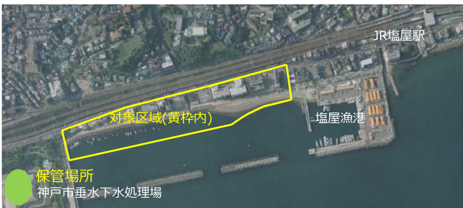
船舶等の放置を禁止する区域