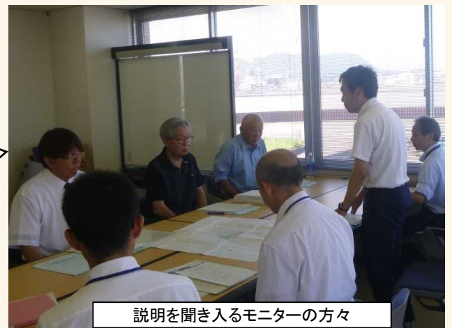
説明を聞き入れるモニターの方々