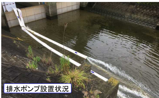
排水ポンプ設置状況