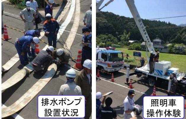
排水ポンプ 設置状況