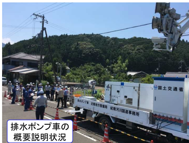
排水ポンプ車の 概要説明状況