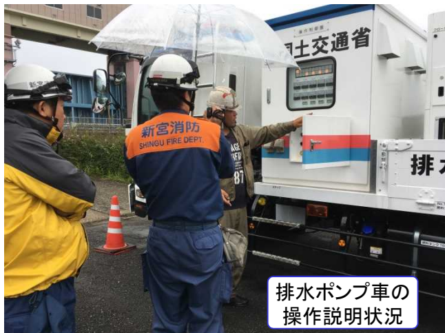
排水ポンプ車の 操作説明状況