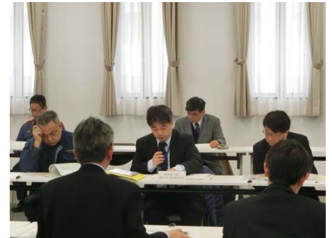
各機関からの発言の様子