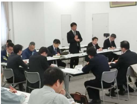
委員長・中貝市長による開会の挨拶