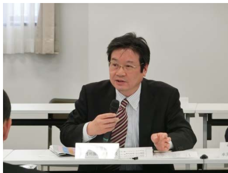
各機関からの発言の様子