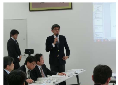
副委員長・由井水災害予報センター長による閉会の挨拶