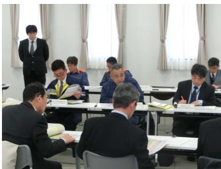
各機関からの発言の様子