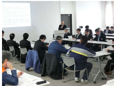
資料の内容説明の様子