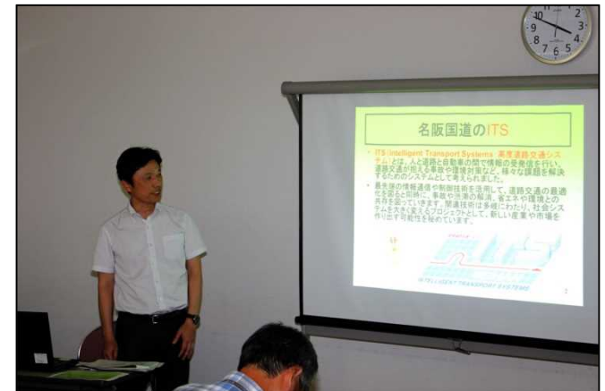
ITSの講義を行う管理第二課長 動画による説明が好評でした

あまり一般に知られていない管理に関する事業については興味津々で聴講され、知見を広げて頂けたようです。