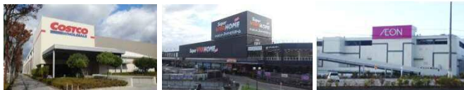
① 八幡市の大規模商業施設（平成23年12月開店） ② 寝屋川市の大規模商業施設（平成23年6月開店） ③ 四條畷市の大規模商業施設（平成27年10月開店）