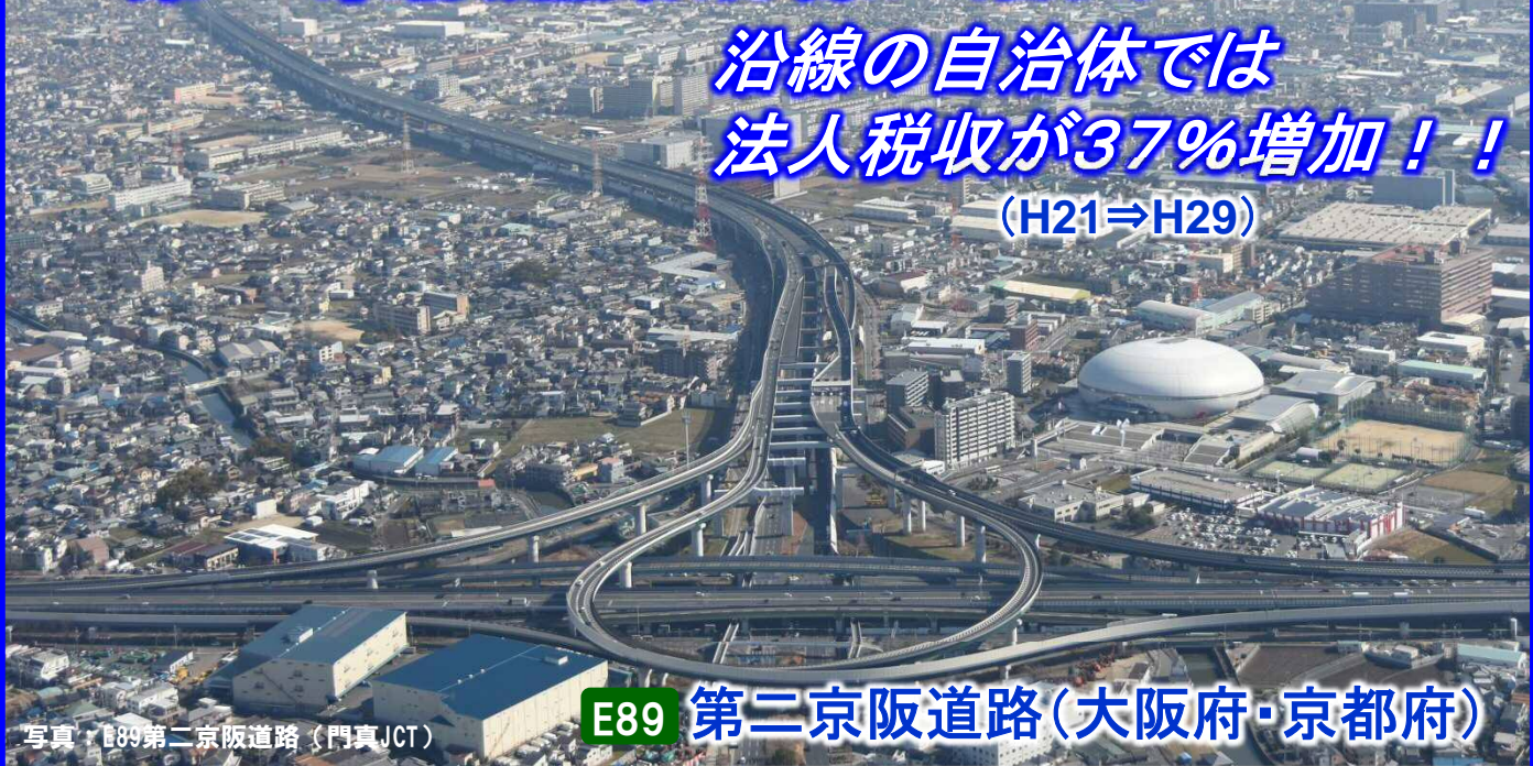
写真：E89第二京阪道路（門真JCT）