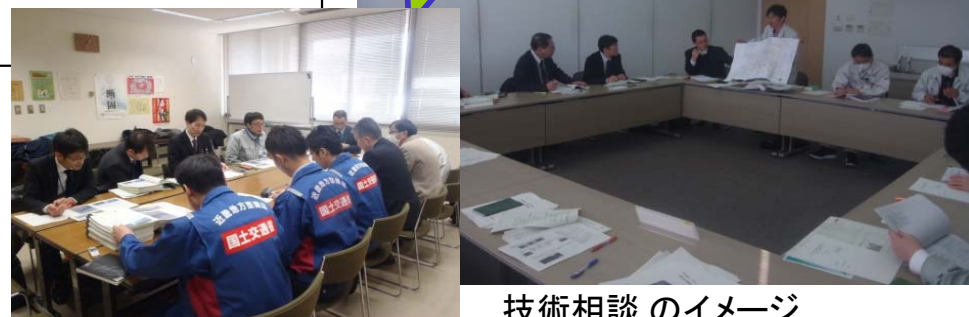
技術相談のイメージ