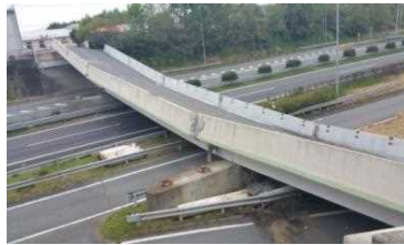
九州自動車道をまたぐ跨道橋の落橋（県道小川嘉島線・府領第一橋）