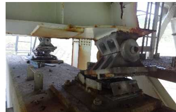
橋梁の支承・主桁の損傷（大分自動車道・並柳橋）