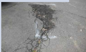
公共土木施設の損傷状況