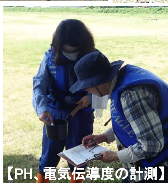
【PH、電気伝導度の計測】