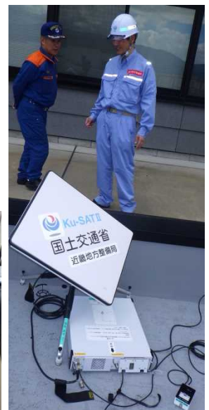
アンテナ設置方法の説明(大野市)