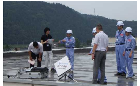
アンテナ設置方法の説明(勝山市)