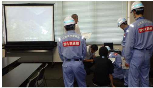
本局より災害映像受信状況(勝山市)