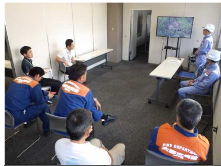
訓練概要の説明状況(大野市)