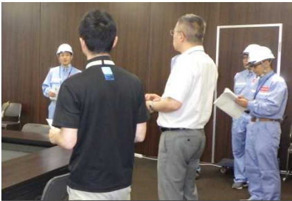
訓練概要の説明状況(勝山市)