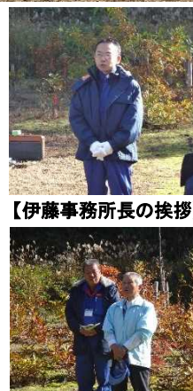
【伊藤事務所長の挨拶】