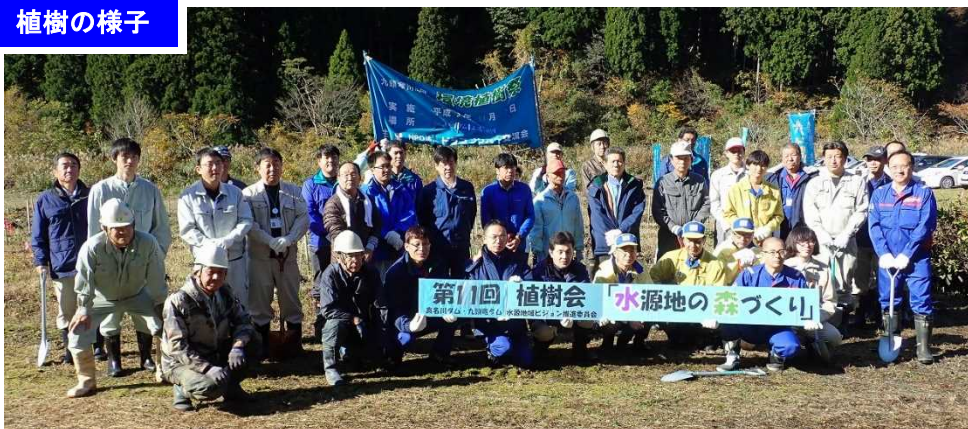
【そろって記念撮影】