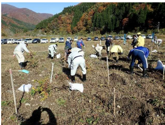
【皆さんで植樹開始】