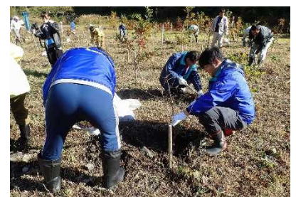
【植樹は初めての方も】