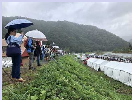
【雨の中応援する観客】