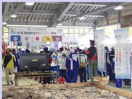
【カヌー競技開会式の様子】