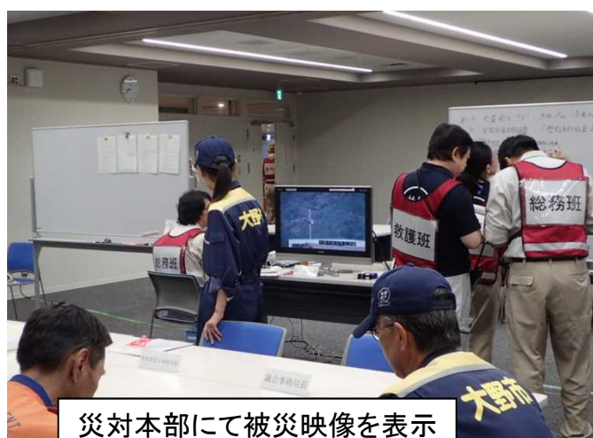
災対本部にて被災映像を表示