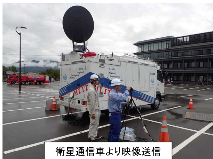
衛星通信車より映像送信