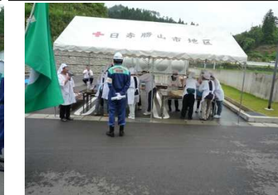
非常食の応急炊飯