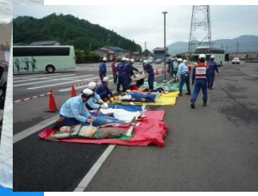
集団災害訓練(救助活動)