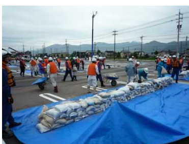
水防訓練(土のう作成)