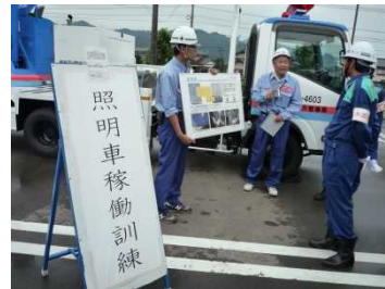
照明車稼働訓練(国土交通省)