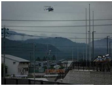
防災ヘリ救助訓練