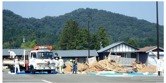
障害物除去(鉄工組合)