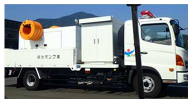
排水ポンプ車(大野市所有)