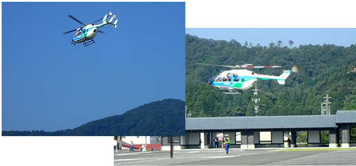
被害状況調査・緊急物資輸送(福井県防災ヘリ)