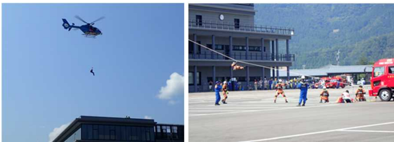
要救助者救助訓練(福井県警防災ヘリ・大野消防)