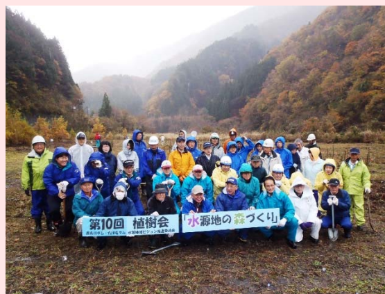
【みんなで記念撮影】