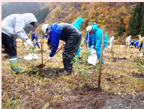
【第10回植樹会の様子】