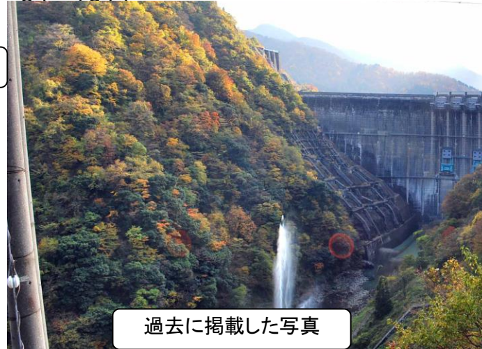
過去に掲載した写真