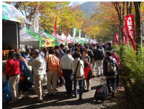
九頭竜紅葉まつり風景

ステージイベントでは、新ご当地キャラクター「ゆいピー」(「うぐピー」「うめピー」ウグイスペアの息子)の紹介や地元小学生が伝統の昇竜太鼓としての笛を演奏するなど広域観光交流推進を目的としたPR活動が行われ、大いに盛り上がりました。