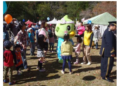
新ご当地キャラ「ゆいピー」のPR活動