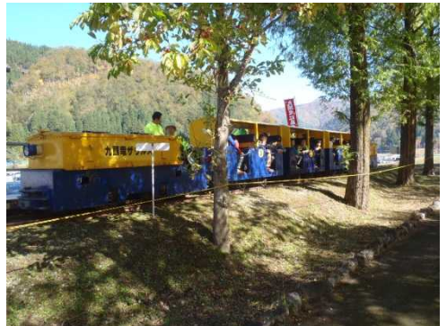
トロッコ列車乗車体験