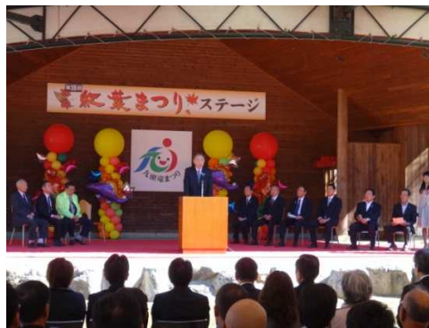
開催式典(大野市長のあいさつ)

また、協働出店された九頭竜自然楽校の方々による流木アート教室は、子どもからお年寄りまで年齢を問わず多くの参加者が集まりました。