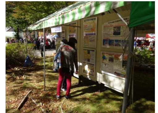
パネル内容の閲覧 ②