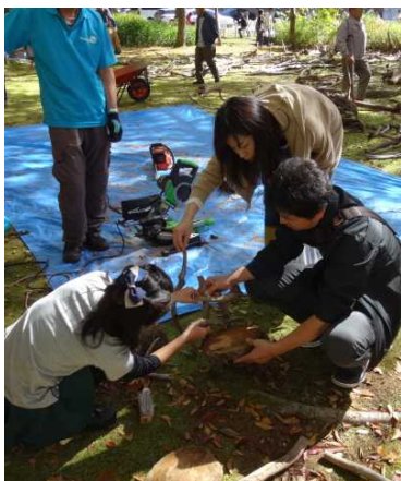
九頭竜自然楽校の 流木アート教室