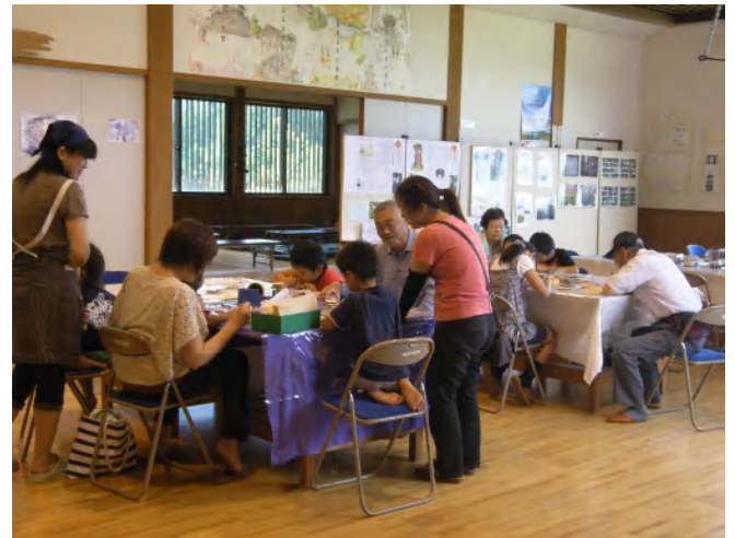
スターランドさかだに会場