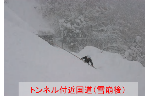
トンネル付近国道(雪崩後)