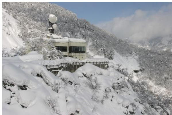
真名川ダム管理支所