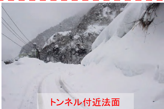
トンネル付近法面