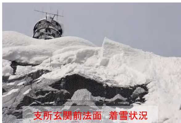
支所玄関前法面 着雪状況