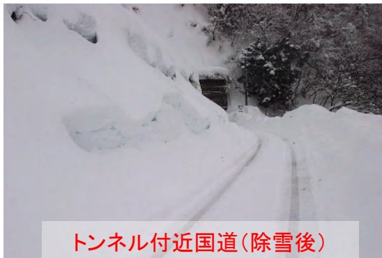
トンネル付近国道(除雪後)