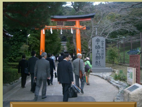
世界遺産・宇治上神社