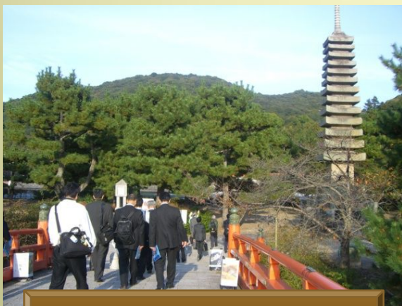
喜撰橋と十三重石塔