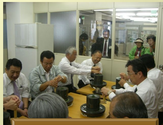
抹茶挽き(福寿園宇治工房)