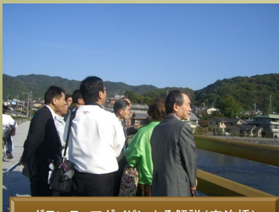
ボランティアガイドによる解説(宇治橋)