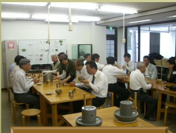
挽き立て抹茶の試飲