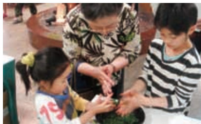
緑茶の作り方体験