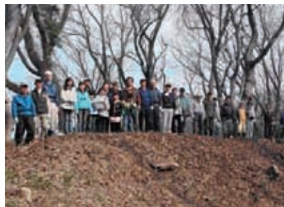
信長陣城跡で保全顕彰会の皆さん