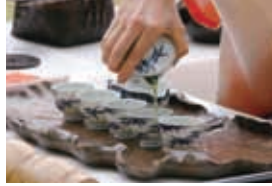
心の込めて淹れられた一煎の玉露

現代に伝わる煎茶道文化にはおもてなしの意義や、思いやりの心、美への感受性の大切さなど現代社会においては欠かすことの出来ないエッセンスが詰まっております。日本人に脈々と伝えられた煎茶を飲みながらの心の交流、相手を尊重して交わる空間というものの素晴らしさ