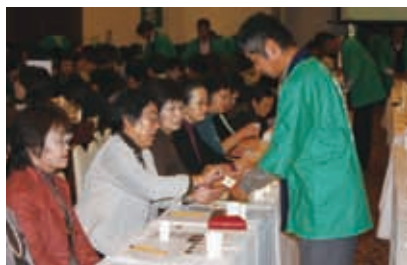
闘茶会様子 大闘茶会③ (H22)