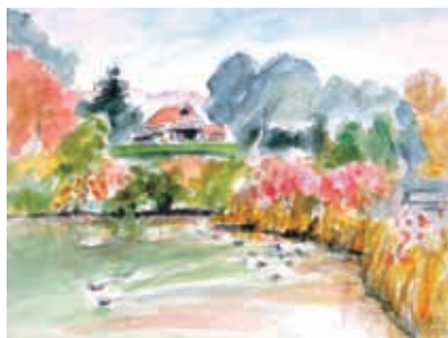
慈光院蓮池（画 磯正子）

第1回目（6月18日） 講演会は、茶の文化について茶室を中心にしたお話、その後、「茶室と庭園」で有名な慈光院を訪ね、寛文6年（1666）京都大徳寺の玉舟和尚が慈光院書院から庭園と大和平野の眺めを称賛され、遠山の四季の風景から慈光院八景を選ばれた、その書院・茶室を拝見し、お庭を拝見しながら解説をして頂きます。