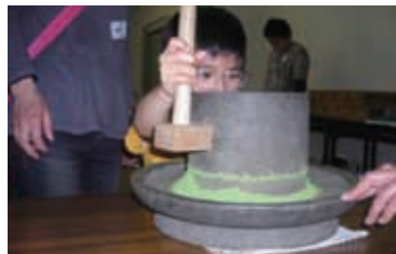
貴重な石臼手挽き体験

その他、別日程での団体、（学校、会社サークル等）でのお茶摘み体験を受け入れます。（日程、費用 別途相談）