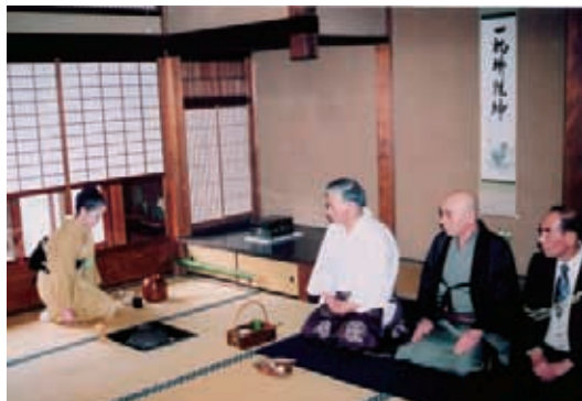
伏見 御香宮月釜での茶会