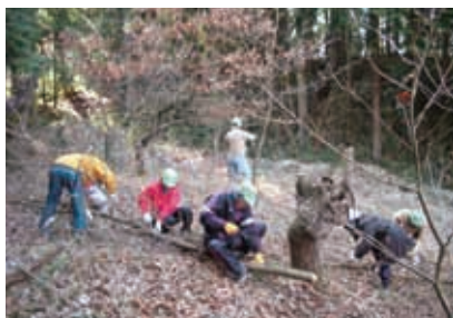
クヌギ林における原木づくり体験