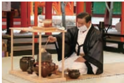
生田神社献茶式にて