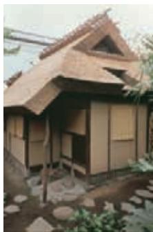
重要文化財茶室 燕庵

藪内流の茶法は「正直を以て心を守り、清浄を以て事を行い、礼和を以て人と交わり、質朴を以て身を修める」を茶の湯の精神としており、これを略して「正直清浄礼和質朴」と表現している。所作は大振りです。