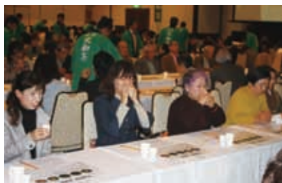
闘茶会様子 大闘茶会① (H22)