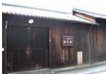
福寿園資料館／京都府木津川市山城町上狛東作り道11