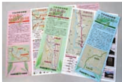
宇治茶歴史街道マップ

◆おいしい宇治茶が飲める「宇治茶カフェ」の認定◆「宇治茶の淹れ方教室」の実施◆山城地域の宇治茶に関係する資源や取組を紹介する「宇治茶歴史街道」の設定と活用◆「宇治茶の郷」と刻した石碑の設置推進◆「宇治茶の郷ウォーク」の実施、◆宇治茶の魅力を広く発信する「宇治茶フェスタ」の実施◆情報誌「宇治茶の郷通信」の発行など。