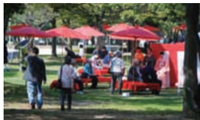
大仙公園茶会風景

利休により大成された茶の湯文化は400年の歴史を経て、今では国際性のある文化として世界的にも知られるようになってきました。堺大茶会を通じて、茶の湯文化の多様な情報を国内外に発信し、「茶の文化」にまつわる資源ネットワークの形成や、圏域の集客増進と活性化に寄与してまいります。