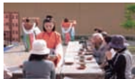
昨年の平城遷都1300年祭「天平茶会」の様子。本年は秋に行われます。