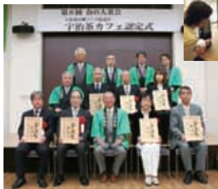
お茶の淹れ方教室と宇治茶カフェ認定

(社)京都府茶業会議所、京都府茶協同組合、京都府茶生産協議会、JA京都やましろ、日本茶インストラクター協会京都府支部、京都府茶業連合青年団、京都府山城広域振興局、宇治市、城陽市、久御山町、八幡市、京田辺市、井手町、宇治田原町、木津川市、笠置町、和束町、精華町、南山城村