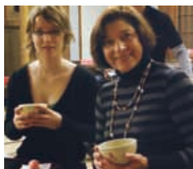
外国人の方も気軽にお茶をお楽しみ頂いております。2階には茶室があります。