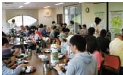
日本茶インストラクターによるお茶の淹れ方教室