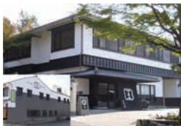
福寿園宇治茶工房／京都府宇治市宇治山田10 福寿園宇治茶菓子工房／京都府宇治市宇治蓮華35