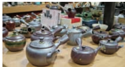
四日市萬古焼急須