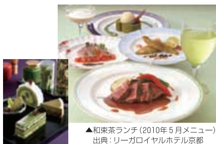
▲和束茶ランチ(2010年5月メニュー)