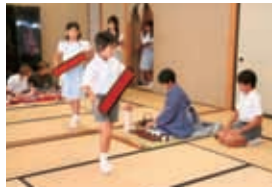
小学生文化交流会(煎茶会でおもてなし)