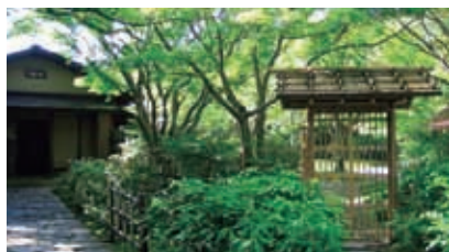
新緑の季節の汎庵

「万里庵」では外国からの来賓をお茶で接待しました。それらの接待をとおして日本の伝統文化と「おもてなしの心」を世界に発信していました。現代の日常生活においても、「お茶」を飲みながらのおしゃべりは楽しくて心弾むもの。時代に関係なく愛され続ける「お茶」のつくり出す空間を、いつもとちょっと違うかたちで楽しんでみませんか？「お茶」がつくりだす非日常でのおしゃべりは、きっといつもより楽しくなるはずです。