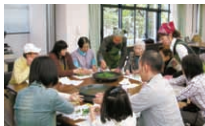
ホットプレートによる簡単な製茶