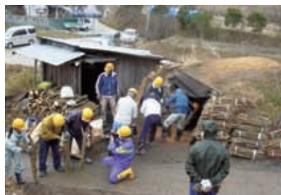
炭焼き体験 原木の窯入れ