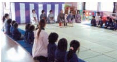
大谷保育園体験茶会風景