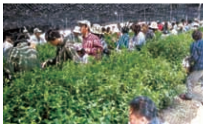
玉露園の茶摘み体験