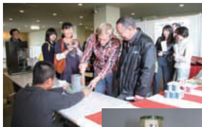
抹茶石臼挽き体験