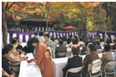
有馬大茶会 瑞宝寺公園席