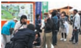
「お茶の始まりを旅する」ツアー紹介やおにぎりの販売