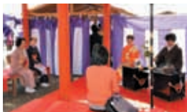
畿央大学茶道部の皆さんによる御茶席。

秋の天平祭においては、平城遷都1300年祭においても行われた「天平茶会」を開催、天平時代の古式を思わせる茶会です。