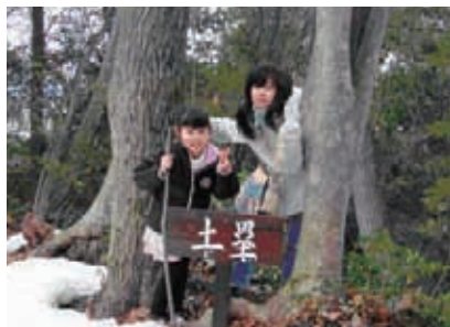
遺構の案内板設置