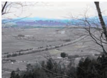
信長馬場より南方横山城を眺望