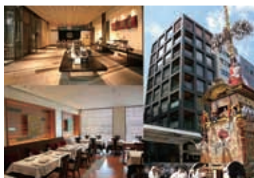
福寿園京都本店前を通る祇園祭山鉦巡行 ／京都府京都市下京区四条通露小路角

京都にある素晴らしい伝統の技を、茶という命題で結集し、フランス料理のレストランも取り入れ、京物に新しい息吹を生み出しています。