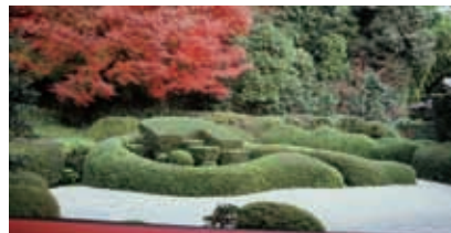
秋の大池寺「蓬萊庭園」