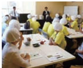
お茶の淹れ方教室