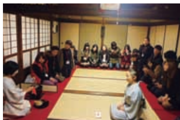
茶道体験もできます。