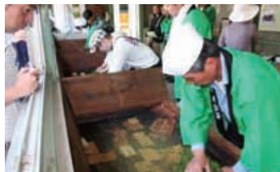
宇治茶製法による手もみ製茶実演