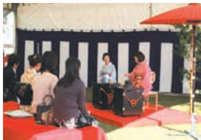
和歌山城市民茶会裏千家茶席風景