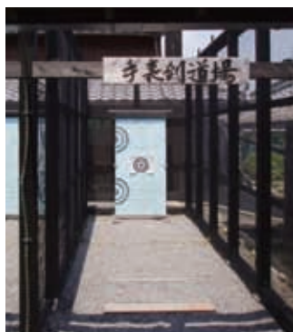
甲賀流忍術屋敷 手裏剣道場