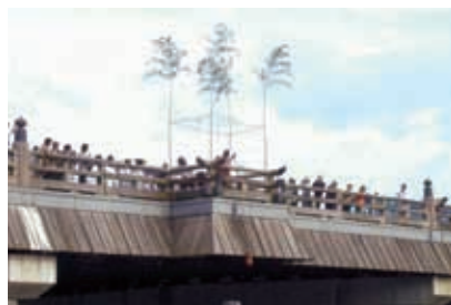
名水汲み上げの儀

茶香服は古くから茶の製造業者が品格鑑定のため、茶の形・色・味・香りの優劣を競うために行ったものですが、足利時代には娯楽遊戯として流行し、桃山時代には千利休が茶の湯とともに取り入れ、茶の余技として行われた歴史ある催しです。