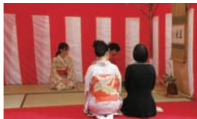
大仙公園茶会風景

の雰囲気盛り上げるため、茶の湯文化とともに歩んできた堺市内の和菓子の販売や、琴・尺八による箏曲の演奏、いけばな無料体験も開催します。