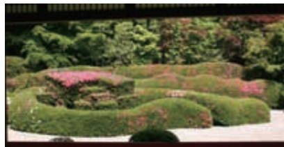
春の大池寺「蓬萊庭園」

是非、この大池寺蓬萊庭園にて、普段の生活から少し離れた、静寂なお時間をお過ごしください。