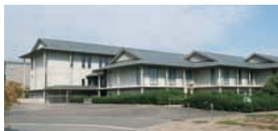
福寿園CHA研究センター／京都府木津川市相楽台3-1-3