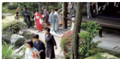
22年度 茶会席 席入り風景