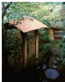
武者小路千家露地中門 編笠門

武者小路千家の当主が名乗る「宗守」の名は、一翁の参禅の師である大徳寺の第185世玉舟宗瑠和尚の命名で、歴代家元がこの名を襲名しています。また、その折同時に示された「宗屋」の名は代々後嗣に継がれ、「宗安」は隠居後の号となっております。