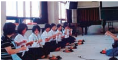
長浜西中学校伝統文化茶道講座指導風景

小堀町遠州会館／長浜市小堀町196-1 長浜公民館・長浜西中学校／長浜市高田町10-10 長浜城歴史博物館4階茶室／長浜市公園町10-10 大谷保育園／長浜市元浜町32-4 長浜幼稚園／長浜市朝日町5-14 六荘認定こども園／長浜市勝町491