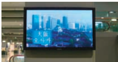
◀ 関空ウエルカムビジョンー関西の紹介映像を流しています

そこで、今なお、われわれの生活文化に深く根づく「茶」をテーマに、その歴史やおもてなしの精神などについて紹介する特別番組(各4分/3回シリーズ(予定))を制作・放映いたします。