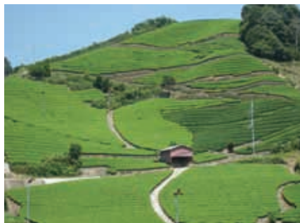
京都府景観資産登録第1号①