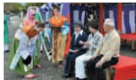
奈良教育大学の皆さんによる御茶席。留学生も参加し、新聞取材もありました。