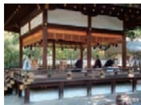
平野神社 紫式部祭献茶式 舞楽殿での献茶の様子