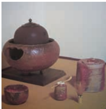
茶器（パネル／甲賀市信楽伝統産業会館所蔵）