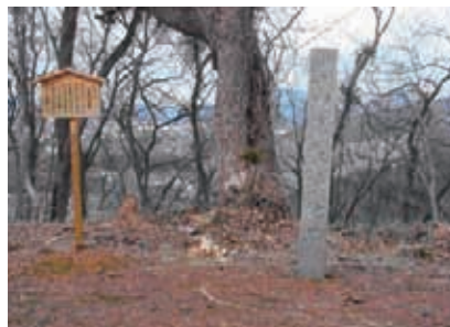
伝織田信長陣城跡