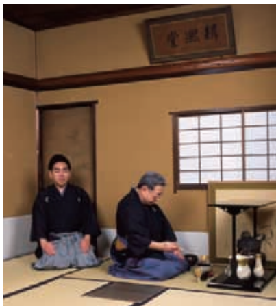
絹糸堂でのお点前

性的であり、帛紗は右側につけるのが特徴である。また、利休時代からの台子の茶法、小間における侘びの茶法の両様を兼ね備えているのも大きな特徴である。