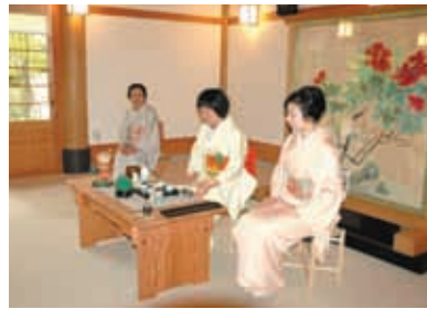
下鴨神社 直会殿での煎茶席