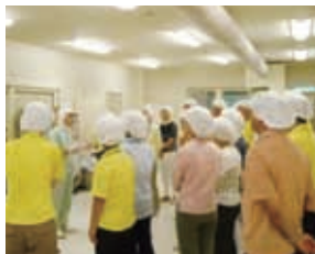
工場見学での説明

※会場の都合上、人数を制限させていただいております。申し込み多数の場合は、抽選になりますのでご了承ください。結果はメールの返信でご連絡させていただきます。