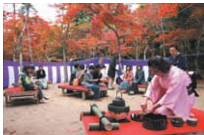
瑞宝寺公園もみじ茶会