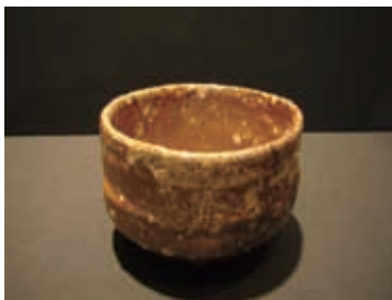
茶碗（甲賀市信楽伝統産業会館所蔵）