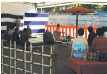
和歌山城市民茶会表千家茶席風景