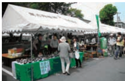
萬古急須 利き茶クイズ