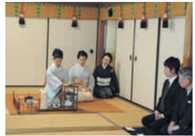
平安神宮 勅使館での煎茶席