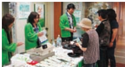
新茶のお値打ち販売

さらに、新茶を使った電子レンジによる緑茶の作り方体験コーナー(参加無料)を設置することにより、お茶の香り、うまみ、手造りの良さを理解していただきます。