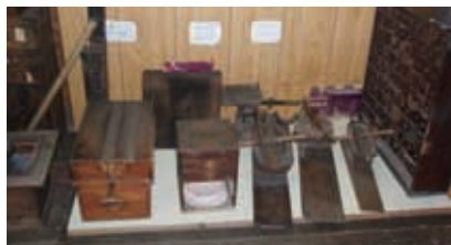
甲賀流忍術屋敷 展示品