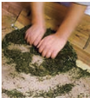
手揉み仕上げの工程