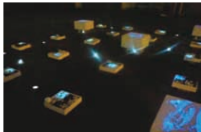
夜に光る庭アイテム