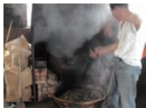
京番茶をつくる様子