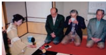
長浜城歴史博物館添釜席