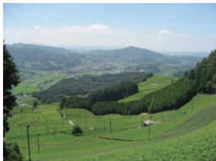
京都府景観資産登録第1号②