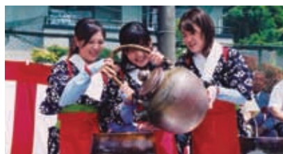
直径約30センチの大茶碗で新茶を飲む「大茶盛」