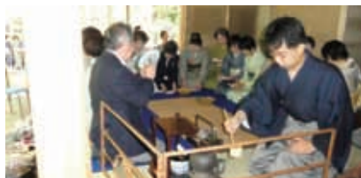
22年度 みえ県民茶会 茶室での薄茶点前