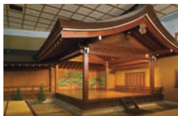
扉を開けると周りの喧嘩からは想像できない静謐は能楽堂があります。