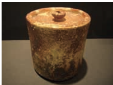
水指（甲賀市信楽伝統産業会館所蔵）