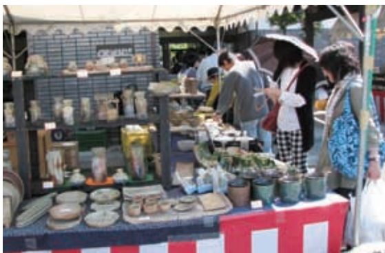
伊賀焼新緑陶器市

伊賀焼伝統産業会館前周辺でテントで陶器の展示即売市、格安で掘り出し物が多く出品される。又丸柱地区一帯でも窯元や、陶芸作家およそ30軒が皿や湯呑等の食器類からオブジェまでバラエティーに富んだ陶器が所狭しと並んで軒を重ねている。