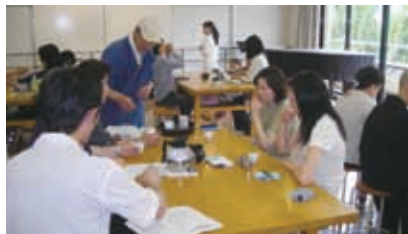
ワクワク茶歌舞伎風景