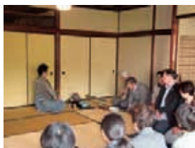
近江八幡市立資料館・西川邸にて ひむれの里茶会の様子