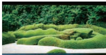
夏の大池寺「蓬萊庭園」