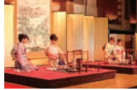
家元叙祝賀会における祝賀茶席