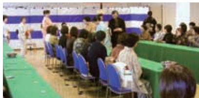
21年度 みえ県民茶会 立礼席 風景