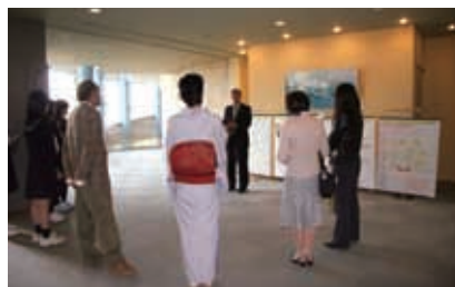
パネルを用いた説明

てん茶の産地であることや、お茶の良さを若い人々に知ってもらえる様、茶関係者が協働して催している心和むイベントです。