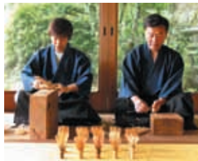
出典：食ゆき奈良 高山茶釜（竹茗堂 久保左文） 出典：竹茗堂