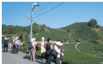
宇治茶の郷ウォーク