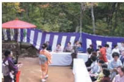
有馬大茶会 瑞宝寺公園席