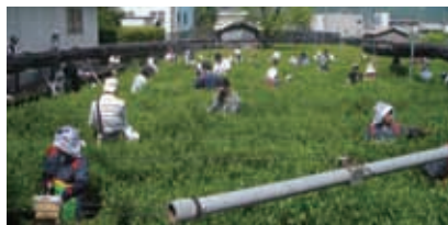
楽しい茶摘み風景

まるまる一日、お茶尽くしのイベントで、日本緑茶発祥の地宇治田原をご家族やお友達とご堪能下さい。