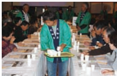
闘茶会様子 大闘茶会② (H22)