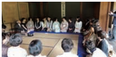
22年度 みえ県民茶会 畳席での茶席風景

昨年度は桑名市にある国の重要文化財指定の施設で3流派による茶会を名勝指定のある庭園の参観を兼ね開催しました。延べ千数百名の一般県民の参加があり盛況でありました。