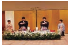
男性による両勝手手前

を関西から発信していく機会になればと考えています。四季を通じ、各地で煎茶会を実施しております。ご興味のある方は、是非お越しください。