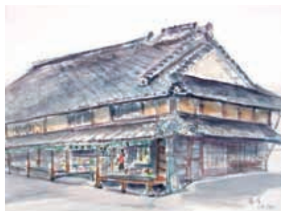
本家菊屋（画 磯正子）

第3回目（2月19日） 郡山城で益梅展を見学、その後本家菊屋の茶室でお茶を戴き茶の文化を味わいます。