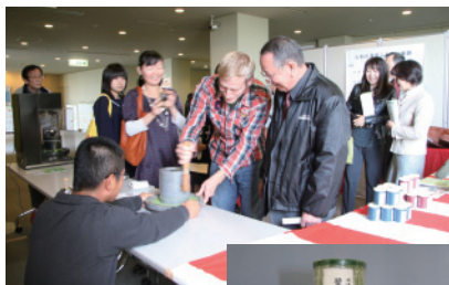
抹茶石臼挽き体験