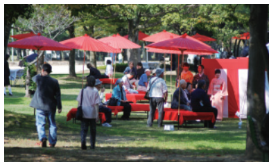
大仙公園茶会風景

利休により大成された茶の湯文化は400年の歴史を経て、今では国際性のある文化として世界的にも知られるようになってきました。堺大茶会を通じて、茶の湯文化の多様な情報を国内外に発信し、「茶の文化」にまつわる資源ネットワークの形成や、圏域の集客増進と活性化に寄与してまいります。