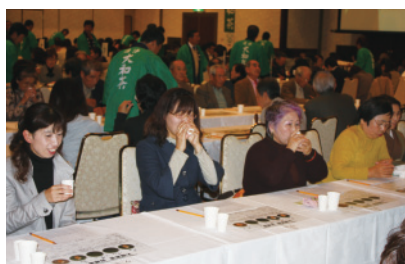
闘茶会様子 大闘茶会① (H22)