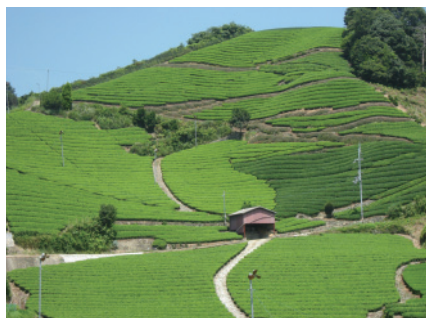
京都府景観資産登録第1号①