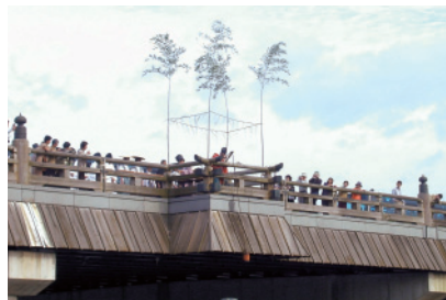
名水汲み上げの儀

茶香服は古くから茶の製造業者が品格鑑定のため、茶の形・色・味・香りの優劣を競うために行ったものですが、足利時代には娯楽遊戯として流行し、桃山時代には千利休が茶の湯とともに取り入れ、茶の余技として行われた歴史ある催しです。