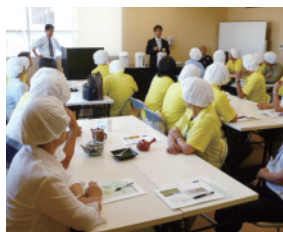
お茶の淹れ方教室