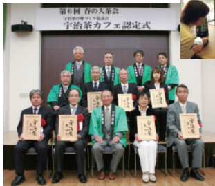
お茶の淹れ方教室と宇治茶カフェ認定

(社)京都府茶業会議所、京都府茶協同組合、京都府茶生産協議会、JA京都やましろ、日本茶インストラクター協会京都府支部、京都府茶業連合青年団、京都府山城広域振興局、宇治市、城陽市、久御山町、八幡市、京田辺市、井手町、宇治田原町、木津川市、笠置町、和束町、精華町、南山城村