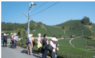
宇治茶の郷ウォーク