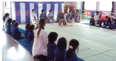
大谷保育園体験茶会風景