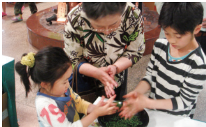
緑茶の作り方体験