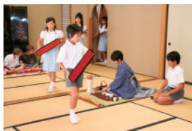
小学生文化交流会(煎茶会でおもてなし) 男性による両勝手点前