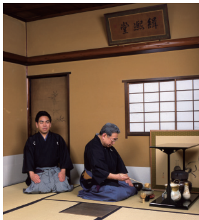
絹糸堂でのお点前

性的であり、帛紗は右側につけるのが特徴である。また、利休時代からの台子の茶法、小間における侘びの茶法の両様を兼ね備えているのも大きな特徴である。