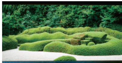
夏の大池寺「蓬莱庭園」