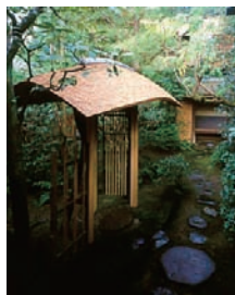
武者小路千家露地中門 編笠門

武者小路千家の当主が名乗る「宗守」の名は、一翁の参禅の師である大徳寺の第185世玉舟宗璠和尚の命名で、歴代家元がこの名を襲名しています。また、その折同時に示された「宗屋」の名は代々後嗣に継がれ、「宗安」は隠居後の号となっております。