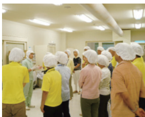
工場見学での説明

※会場の都合上、人数を制限させていただいております。申し込み多数の場合は、抽選になりますのでご了承ください。結果はメールの返信でご連絡させていただきます。