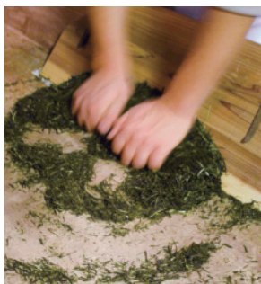
手揉み仕上げの工程