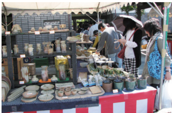
伊賀焼新緑陶器市

伊賀焼伝統産業会館前周辺でテントで陶器の展示即売市、格安で掘り出し物が多く出品される。又丸柱地区一帯でも窯元や、陶芸作家およそ30軒が皿や湯呑等の食器類からオブジェまでバラエティーに富んだ陶器が所狭しと並んで軒を重ねている。