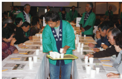
闘茶会様子 大闘茶会② (H22)