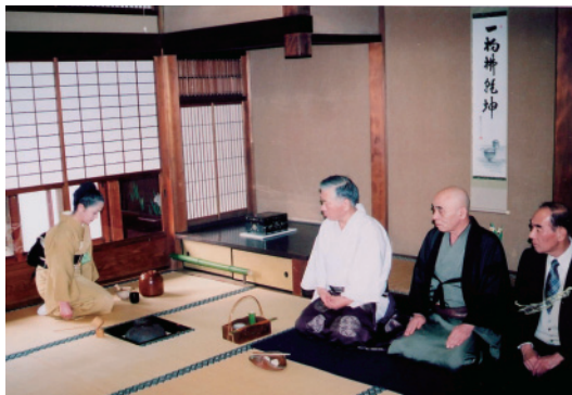
伏見 御香宮月釜での茶会

是非、茶会に参加していただき、茶道の新たな面を再認識して頂きたいと思っております。