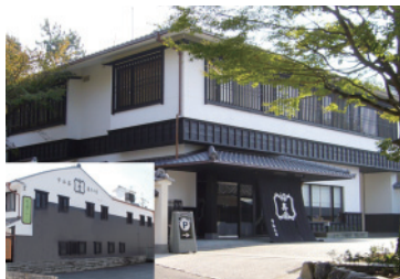
福寿園宇治茶工房／京都府宇治市宇治山田10 福寿園宇治茶菓子工房／京都府宇治市宇治蓮華35