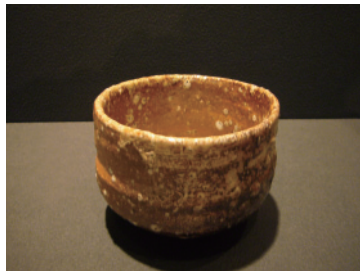
茶碗（甲賀市信楽伝統産業会館所蔵）