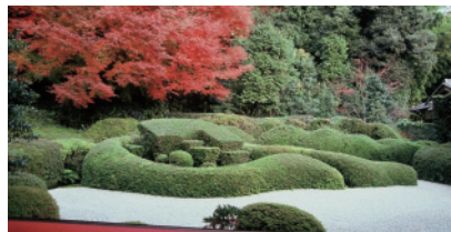
秋の大池寺「蓬莱庭園」