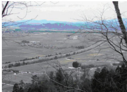
信長馬場より南方横山城を眺望