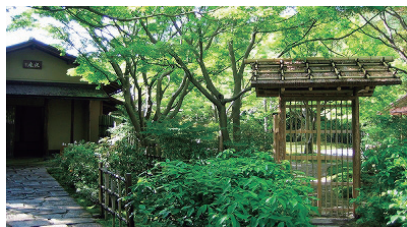
新緑の季節の汎庵

「万里庵」では外国からの来賓をお茶で接待しました。それらの接待をととして日本の伝統文化と「おもてなしの心」を世界に発信していました。現代の日常生活においても、「お茶」を飲みながらのおしゃべりは楽しくて心弾むもの。時代に関係なく愛され続ける「お茶」のつくり出す空間を、いつもとちょっと違うかたちで楽しんでみませんか？「お茶」がつくりだす非日常でのおしゃべりは、きっといつもより楽しくなるはずです。