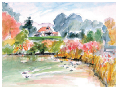
慈光院蓮池（画 磯正子）

第1回目（6月18日） 講演会は、茶の文化について茶室を中心にしたお話、その後、「茶室と庭園」で有名な慈光院を訪ね、寛文6年（1666）京都大徳寺の玉舟和尚が慈光院書院から庭園と大和平野の眺めを称賛され、遠山の四季の風景から慈光院八景を選ばれた、その書院・茶室を拝見し、お庭を拝見しながら解説をして頂きます。