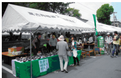
萬古急須 利き茶クイズ