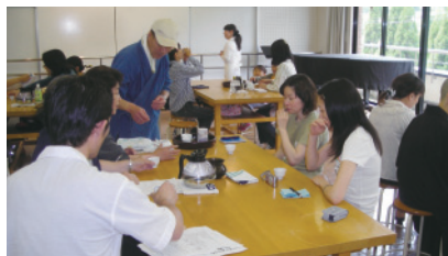
ワクワク茶歌舞伎風景