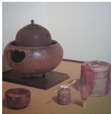
茶器（パネル／甲賀市信楽伝統産業会館所蔵）