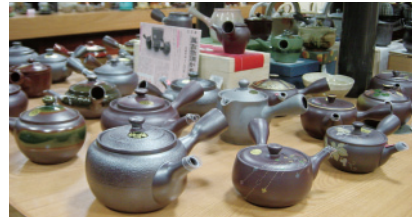
四日市萬古焼急須

さらに、新茶を使った電子レンジによる緑茶の作り方体験コーナー（参加無料）を設置することにより、お茶の香り、うまみ、手造りの良さを理解していただけます。