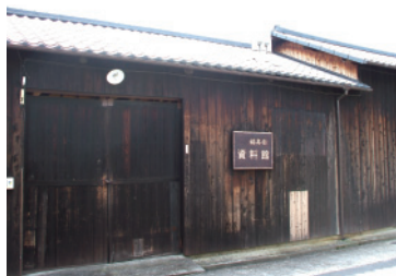
福寿園資料館／京都府木津川市山城町上狛東作り道11