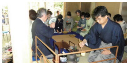
22年度 みえ県民茶会 茶室での薄茶点前