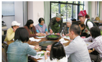
ホットプレートによる簡単な製茶