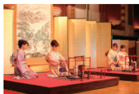
家元叙勲祝賀会における祝賀茶席