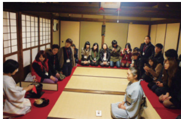
茶道体験もできます。