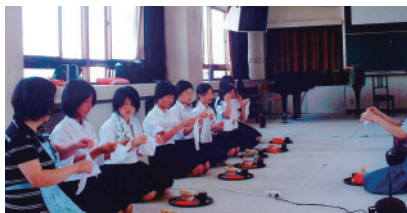
長浜西中学校伝統文化茶道講座指導風景

小堀町遠州会館／長浜市小堀町196-1 長浜公民館・長浜西中学校／長浜市高田町10-10 長浜城歴史博物館4階茶室／長浜市公園町10-10 大谷保育園／長浜市元浜町32-4 長浜幼稚園／長浜市朝日町5-14 六荘認定こども園／長浜市勝町491