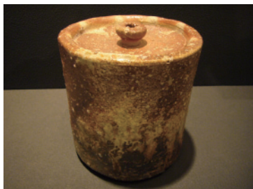
水指（甲賀市信楽伝統産業会館所蔵）