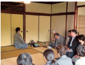
近江八幡市立資料館・西川邸にて ひむれの里茶会の様子