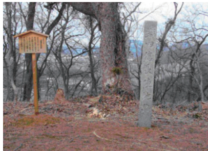
伝織田信長陣城跡