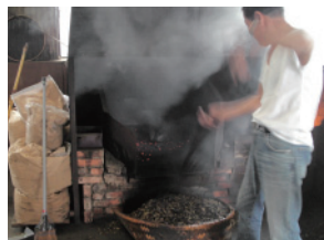
京番茶をつくる様子