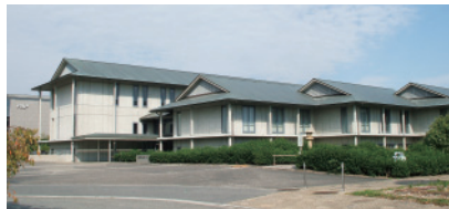
福寿園CHA研究センター／京都府木津川市相楽台3-1-3