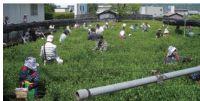
楽しい茶摘み風景

まるまる一日、お茶尽くしのイベントで、日本緑茶発祥の地宇治田原をご家族やお友達とご堪能下さい。