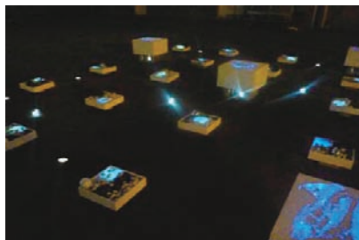
夜に光る庭アイテム