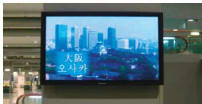
◀ 関空ウエルカムビジョンー関西の紹介映像を流しています

そこで、今なお、われわれの生活文化に深く根づく「茶」をテーマに、その歴史やおもてなしの精神などについて紹介する特別番組(各4分/3回シリーズ(予定))を制作・放映いたします。