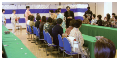
21年度 みえ県民茶会 立礼席 風景