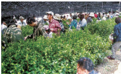
玉露茶園の茶摘み体験