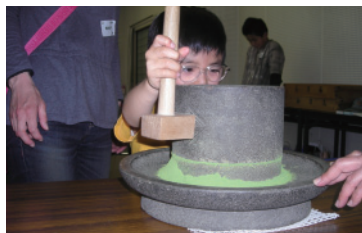
貴重な石臼手挽き体験

その他、別日程での団体、(学校、会社サークル等)でのお茶摘み体験を受け入れます、(日程、費用 別途相談)