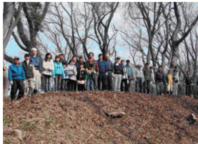
信長陣城跡で保全顕彰会の皆さん