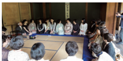
22年度 みえ県民茶会 畳席での茶席風景

昨年度は桑名市にある国の重要文化財指定の施設で3流派による茶会を名勝指定のある庭園の参観を兼ね開催しました。延べ千数百名の一般県民の参加があり盛況でありました。