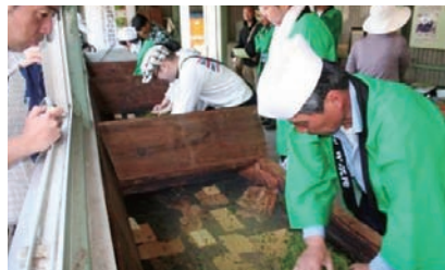
宇治茶製法による手もみ製茶実演