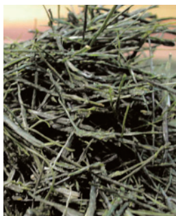
手揉み茶出来上がり