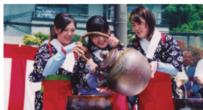
直径約30センチの大茶碗で新茶を飲む「大茶盛」