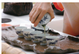
心の込めて淹れられた一煎の玉露

やりの心、美への感受性の大切さなど現代社会においては欠かすことの出来ないエッセンスが詰まっております。日本人に脈々と伝えられた煎茶を飲みながらの心の交流、相手を尊重して交わる空間というものの素晴らしさ