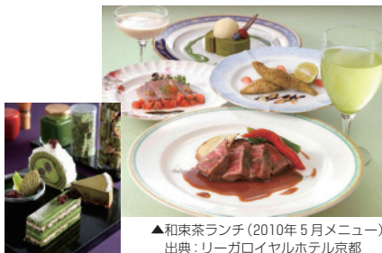
▲和東茶ランチ(2010年5月メニュー)