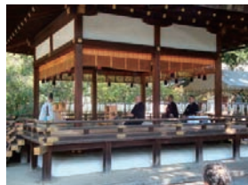
平野神社 紫式部祭献茶式 舞楽殿での献茶の様子