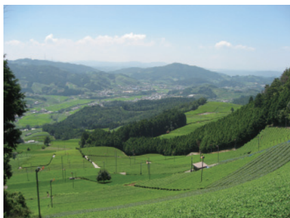
京都府景観資産登録第1号②