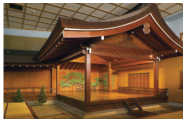
扉を開けると周りの喧嘩からは想像できない静謐は能楽堂があります。