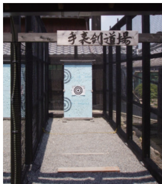
甲賀流忍術屋敷 手裏剣道場