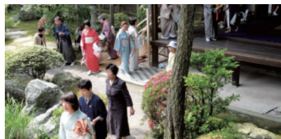
22年度 茶会席 席入り風景