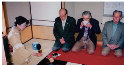
長浜城歴史博物館添釜席