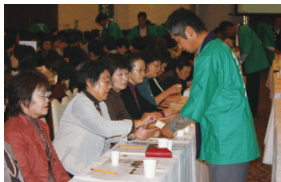
闘茶会様子 大闘茶会③ (H22)