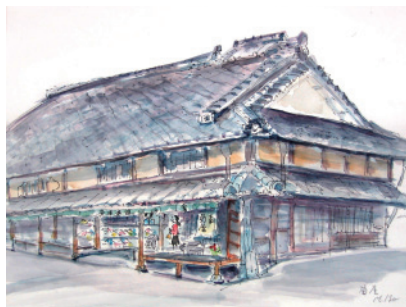
本家菊屋（画 磯正子）

第3回目（2月19日） 郡山城で盆梅展を見学、その後本家菊屋の茶室でお茶を戴き茶の文化を味わいます。