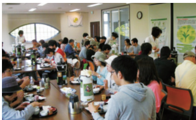
日本茶インストラクターによるお茶の淹れ方教室