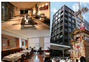
福寿園京都本店前を通る祇園祭山鉾巡行 ／京都府京都市下京区四条通富小路角

京都にある素晴らしい伝統の技を、茶という命題で結集し、フランス料理のレストランも取り入れ、京物に新しい息吹を生み出しています。