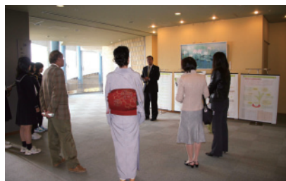
パネルを用いた説明

てん茶の産地であることや、お茶の良さを若い人々に知ってもらえる様、茶関係者が協働して催している心和むイベントです。