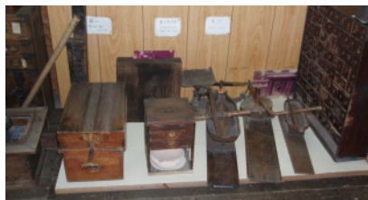
甲賀流忍術屋敷 展示品