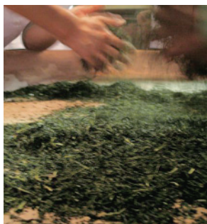
手揉みの工程半ば

永谷宗円については、宇治田原ふるさと歴史くらぶHPをご覧ください。 http://www.geocities.jp/uji_tawara/migi.html