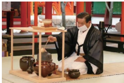
生田神社献茶式にて