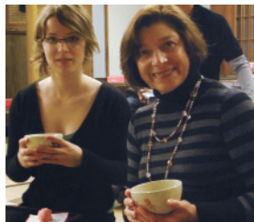
外国人の方も気軽にお茶をお楽しみ頂いております。2階には茶室があります。