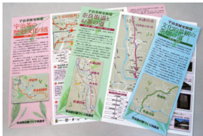
宇治茶歴史街道マップ

◆おいしい宇治茶が飲める「宇治茶カフェ」の認定◆「宇治茶の淹れ方教室」の実施◆山城地域の宇治茶に関係する資源や取組を紹介する「宇治茶歴史街道」の設定と活用◆「宇治茶の郷」と刻した石碑の設置推進◆「宇治茶の郷ウォーク」の実施、◆宇治茶の魅力を広く発信する「宇治茶フェスタ」の実施◆情報誌「宇治茶の郷通信」の発行など。