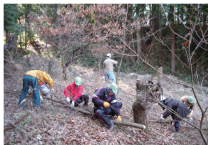
クヌギ林における原木づくり体験