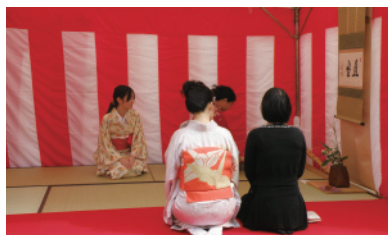
大仙公園茶会風景

の雰囲気を感じ上げるため、茶の湯文化とともに歩んできた堺市内の和菓子の販売や、琴・尺八による箏曲の演奏、いけばな無料体験も開催します。