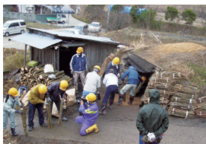
炭焼き体験 原木の窯入れ