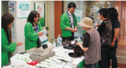
新茶のお値打ち販売

三重県北勢地域の地場産業である伊勢茶は「伊勢の銘茶を萬古焼（ばんこやき）で飲む」と言われるように、四日市萬古焼の急須とともに全国的に知られています。新茶の時期に開催する「新茶フェア」を通じて、急須でお茶を飲む習慣を再認識していただく機会を設けます。