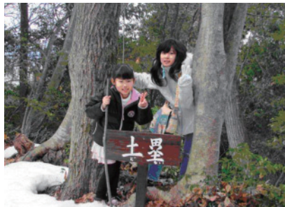
遺構の案内板設置