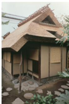
重要文化財茶室 燕庵

藪内流の茶法は「正直を以て心を守り、清浄を以て事を行い、礼和を以て人と交わり、質朴を以て身を修める」を茶の湯の精神としており、これを略して「正直清浄礼和質朴」と表現している。所作は大振りです。