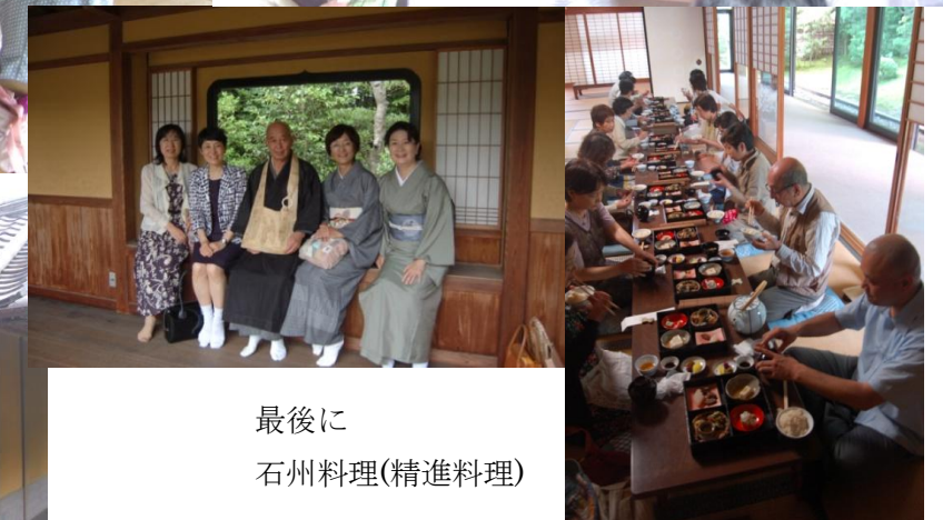
最後に 石州料理(精進料理)