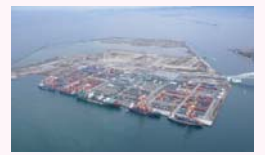
阪神港夢洲コンテナターミナル