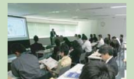
近畿農業・農村6次産業倶楽部の取組