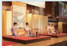
取組参加団体による茶席