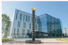
京速コンピュータ「京」施設の外観