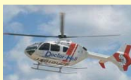
3府県共同ドクターヘリ