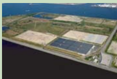
メガソーラー現地写真