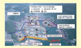
和歌山県下津港海岸(海南地区)